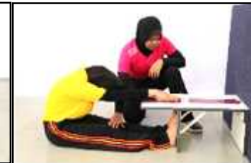
Gambar E Jangkauan Melunjur