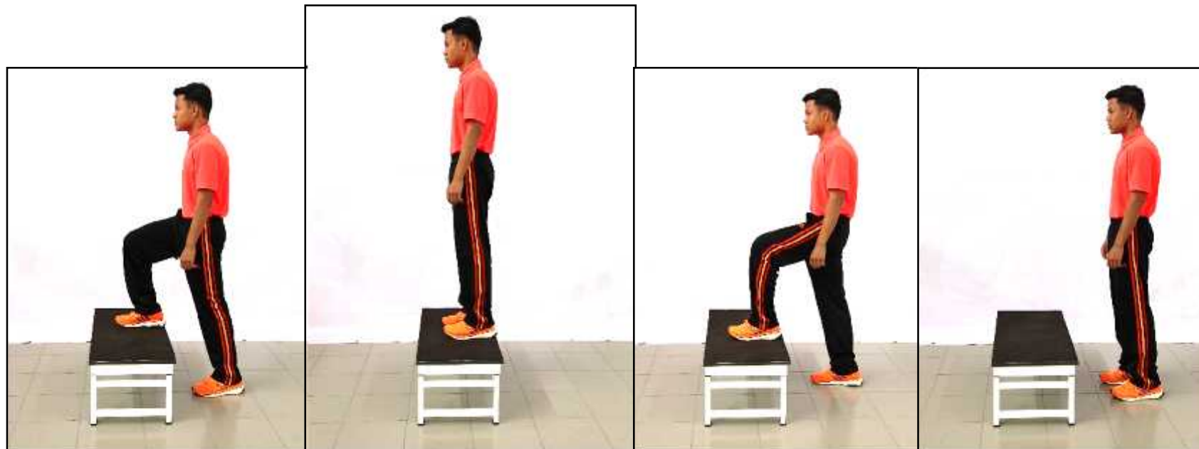
Gambar A - Permulaan naik turun bangku