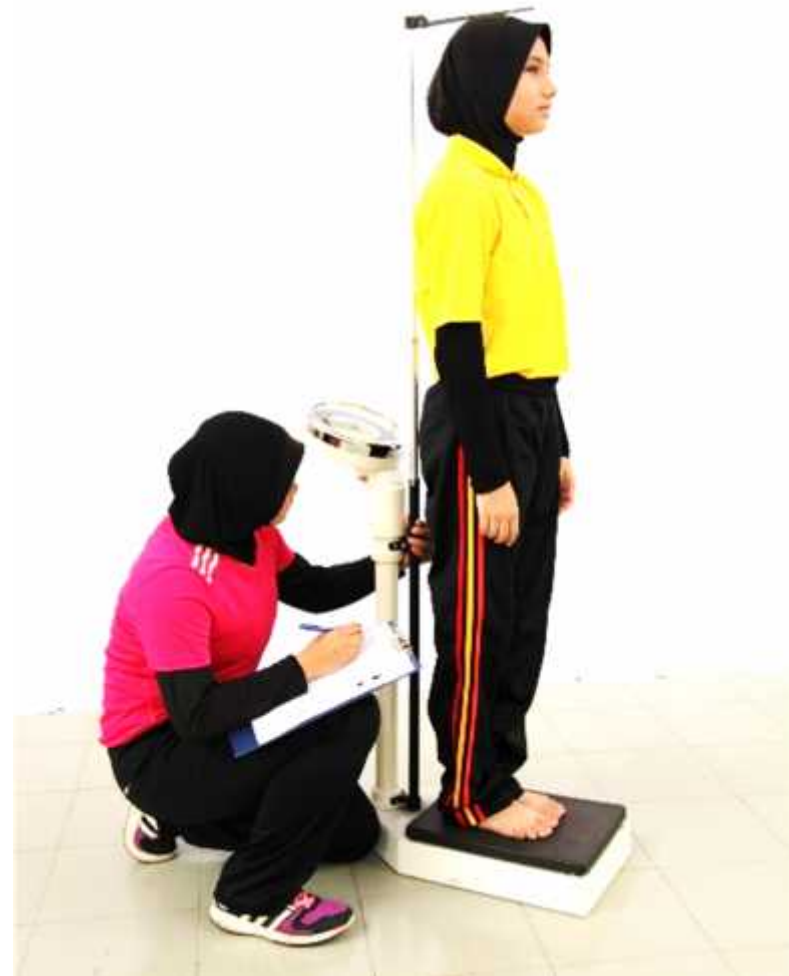
Ilustrasi 3: Mengukur Tinggi