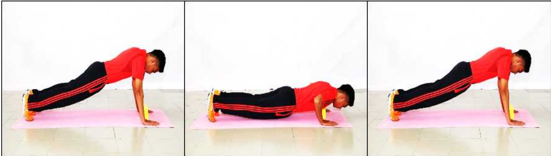
Gambar A - Sokong Hadapan atau Bersedia